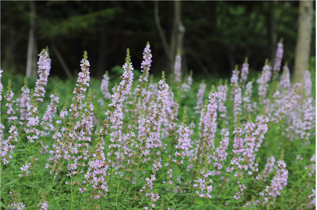
1. 국립백두대간수목원에서 출원한 털부처꽃 ‘백두분홍’