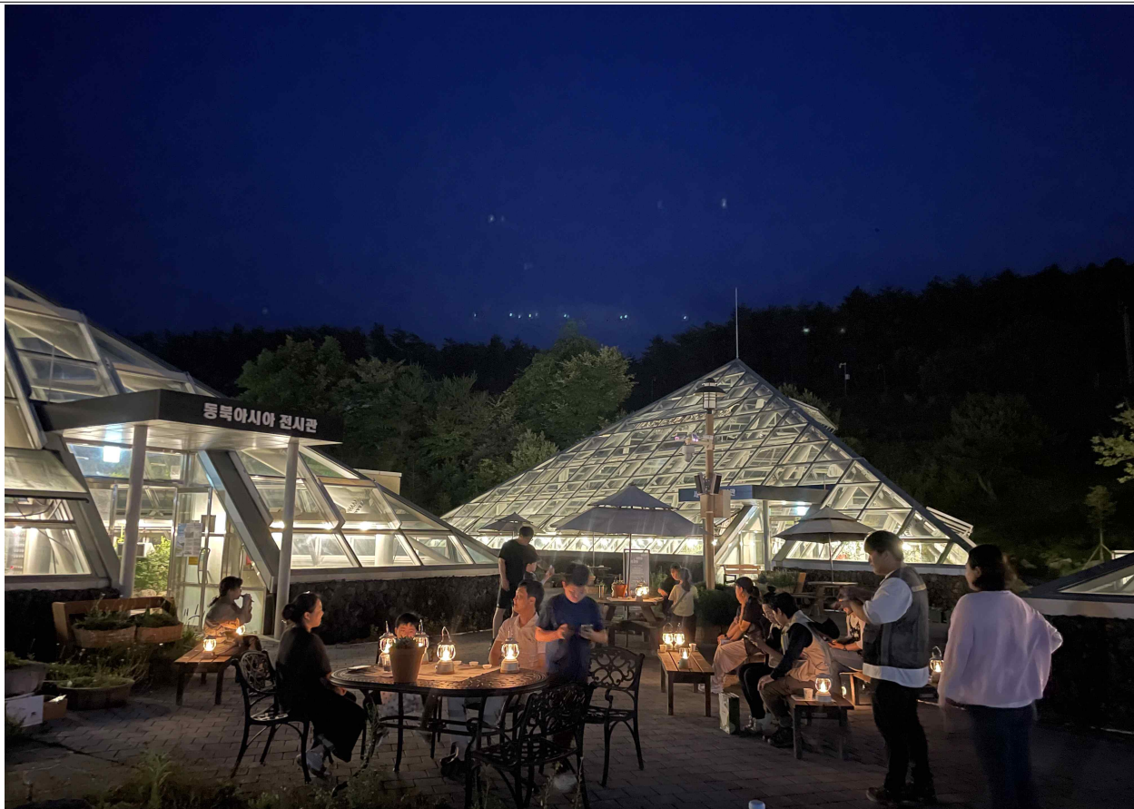
2. 국립백두대간수목원에서 운영하는 '한여름 알파인하우스 꽃별 산책'에 참여한 관람객이 알파인하우스 앞에서 가드너와 담소를 나누고 있다.