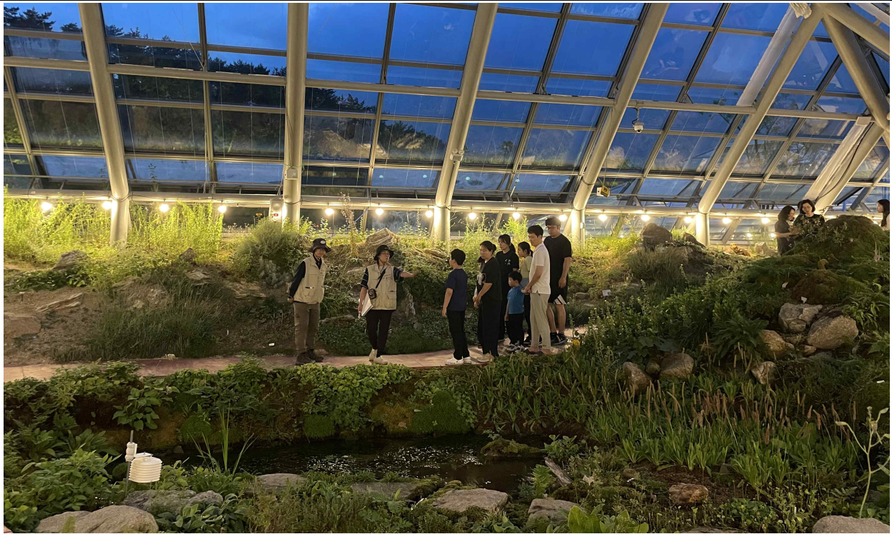
1. 국립백두대간수목원에서 운영하는 '한여름 알파인하우스 꽃별 산책'에 참여한 관람객이 가드너의 해설을 들으며 알파인하우스를 관람하고 있다.