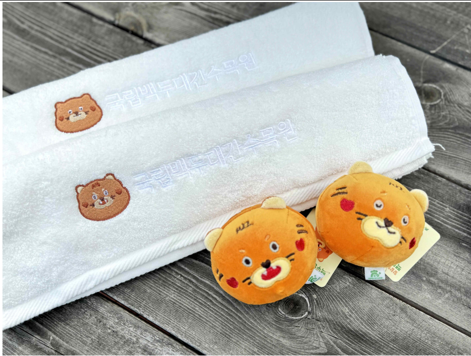
3. 국립백두대간수목원에서 봉화군, 코레일관광개발과 협력해 기차타고 떠나는 테마별 숙박상품 참가자에게 제공되는 특별 기념품인 '백두랑이' 스트레스볼과 수건