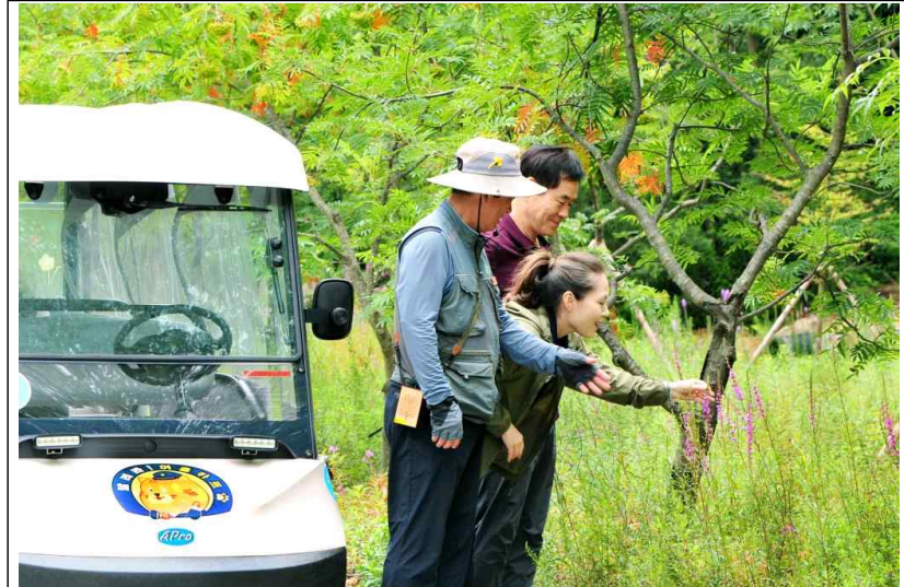
1. 국립백두대간수목원에서 운영하는 프리미엄 카트해설 '달려라!어흥카트!' 참가자가 여름 자생식물인 털부처꽃을 감상하고 있다.