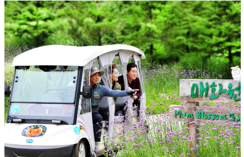
2. 국립백두대간수목원에서 운영하는 프리미엄 카트해설 '달려라!어흥카트!'에 참여한 관람객이 전문 숲해설사의 이야기를 들으며 매화원을 둘러보고 있다.