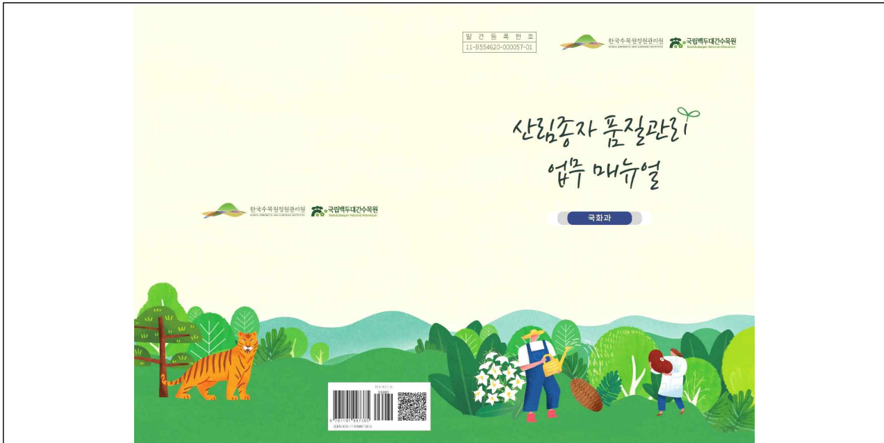
1. 한국수목원정원관리원 누리집에서 확인 가능한 산림종자 품질관리 업무 매뉴얼 표지