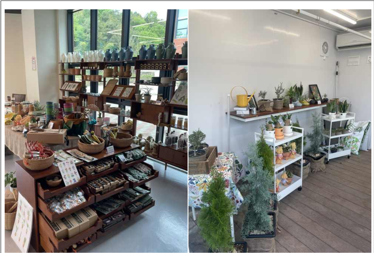
가든샵 현황사진 (방문자센터 내 및 베란다정원)